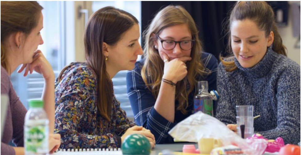
Gruppenarbeit im Master Heilpädagogische Früherziehung.

Die Module à je 5 ECTS-Kreditpunkte umfassen rund 150 Stunden Workload. Diese teilen sich jeweils auf in Kontaktstudium und begleitetes Selbststudium sowie freies Selbststudium.