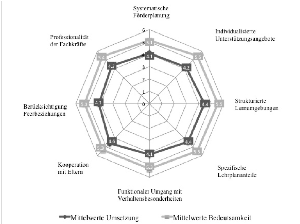
Abbildung 2: Gegenüberstellung der Wertungen von Umsetzung und Bedeutsamkeit innerhalb der Bereiche des Rahmenmodells.

aktuelle Umsetzung und beigemessener Bedeutsamkeit dar. Den Bewertungen der Lehrkräfte zufolge liegen bei diesen Aussagen Realität und Relevanz sehr dicht beieinander. Eine inhaltliche Betrachtung dieser Items zeigt, dass sich in sechs der acht Bereiche des Rahmenmodells Werte mit einer sehr guten Passung zwischen Umsetzung und Bedeutsamkeit finden. Hervorheben lässt sich, dass der Bereich der „Kooperation mit den Eltern“ mit vier Items sehr hoch repräsentiert ist, ebenso wie sich mehrere Items zeigen, die sich auf das Rollenverständnis und die Zuständigkeiten der sonderpädagogischen Lehrkräfte sowie ihre Einbeziehung in die Förderung der Kinder und Jugendlichen mit ASS beziehen.